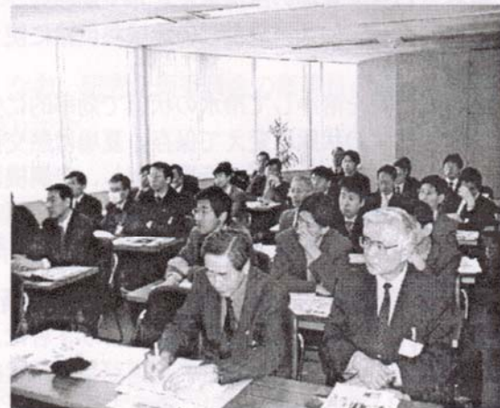
みなとみらい 21 クリーンセンターにて