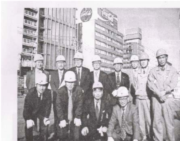
栄公園地区新築工事現場にて

名古屋市の中心部であり地下鉄・バスの交通拠点となる栄地区の立地性を生かし、周辺施設との地下・地上での回遊性を高めることで、都市の活性化や賑わいの創出を図っている。地下広場の屋根は「水の宇宙船」と称する全面ガラス張りの、2,000トンの水を張った大屋根になるのが特長である。また、自然の力を最大限に利用することでエコロジーにも配慮がなされた優れた地下利用計画である。(GECニュース第140号より抜粋)