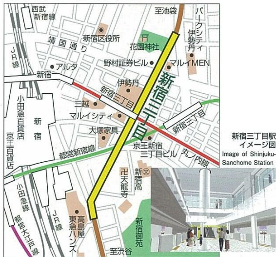
副都心線新宿三丁目駅の位置図

本駅が完成すれば、これまで地上からしかアクセスできなかった高島屋から花園神社までが地下でつながります。さらに、現在、国交省と JR 東日本が進めている新宿三丁目駅と新宿駅を結ぶ地下歩道（新宿駅南口地区基盤整備事業の一部）が完成すれば、新宿駅の東側の地下がサークル状につながるようになります。東京メトロ副都心線の開業は、平成 20 年 6 月 14 日の予定です。