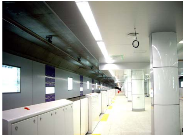
開通前の駅構内の状況