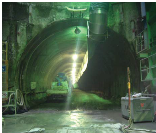
施工中のトンネル状況